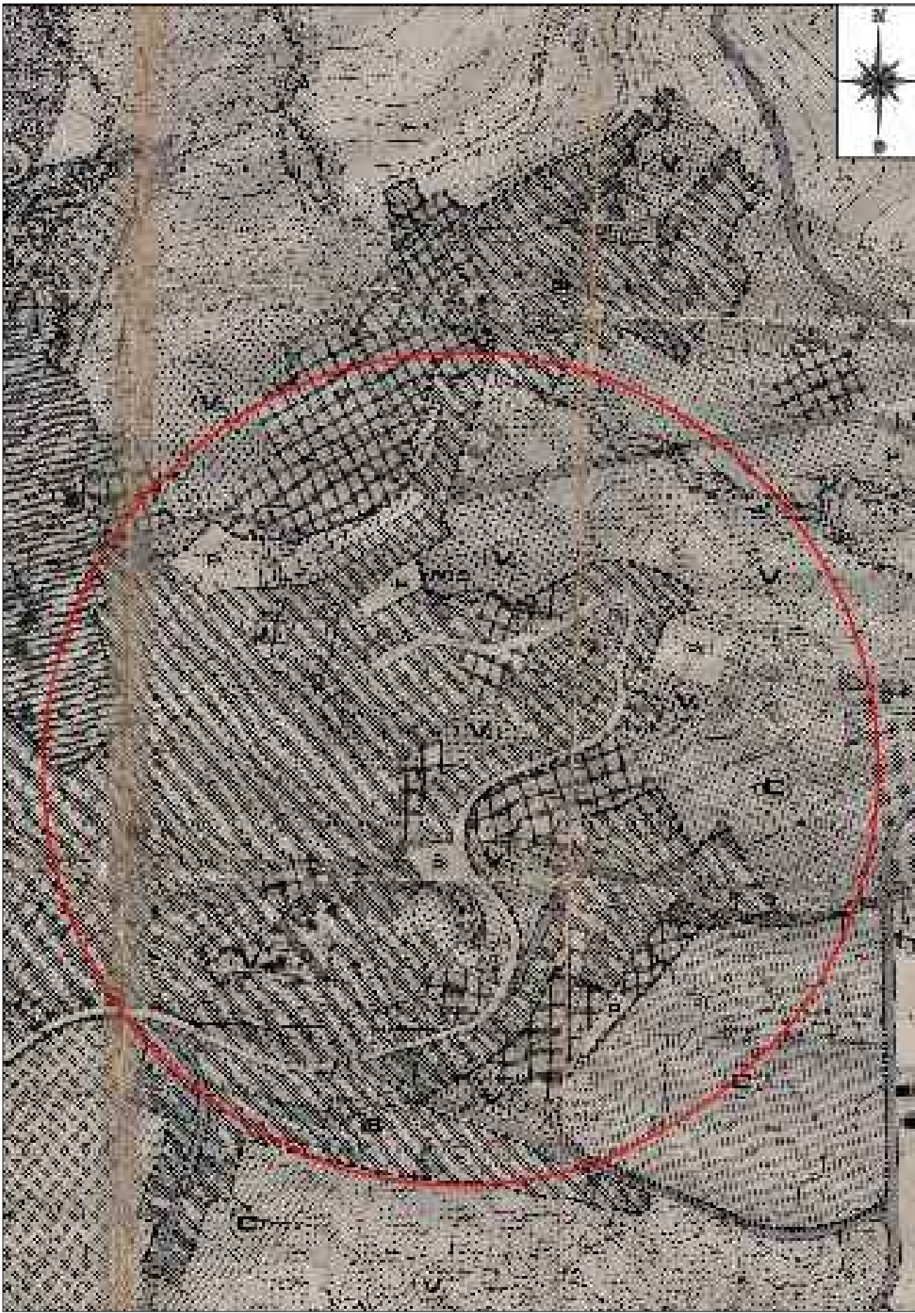
STRALCIO P.R.G. SCALA 1:5000