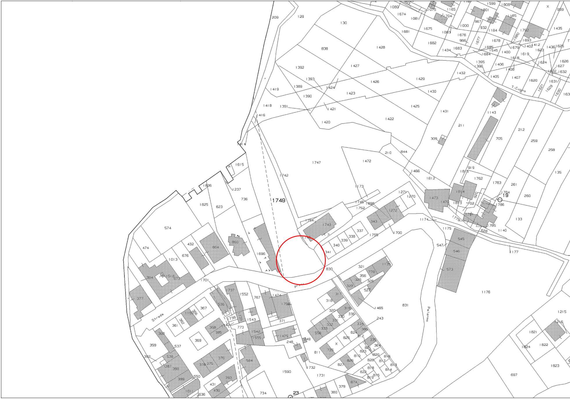
STRALCIO CATASTALE FOGLIO 15 PART. 1749