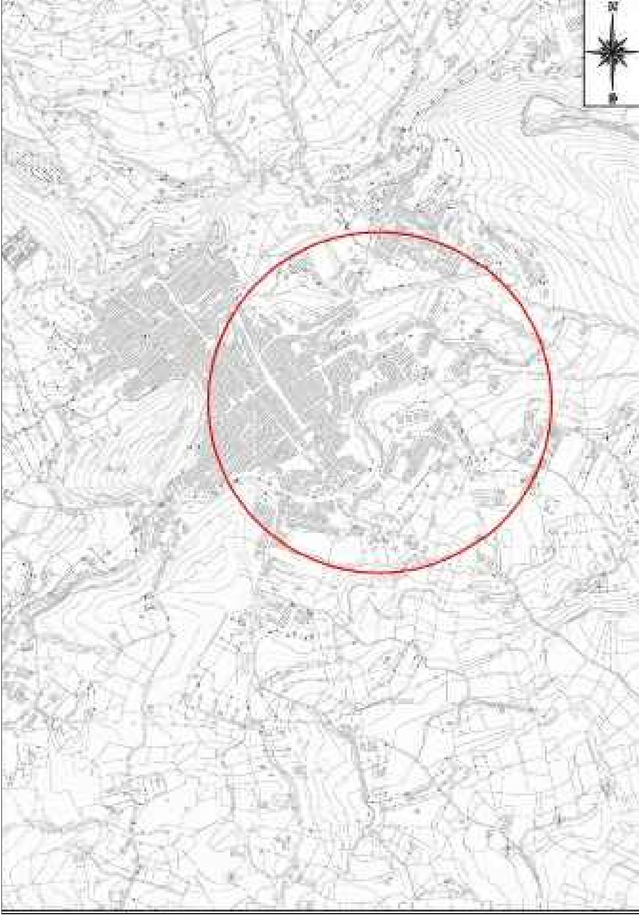
STRALCIO AEROFOTOGRAMMETRIA SCALA 1:10000